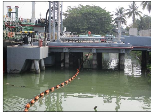
ท่าเทียบเรือ