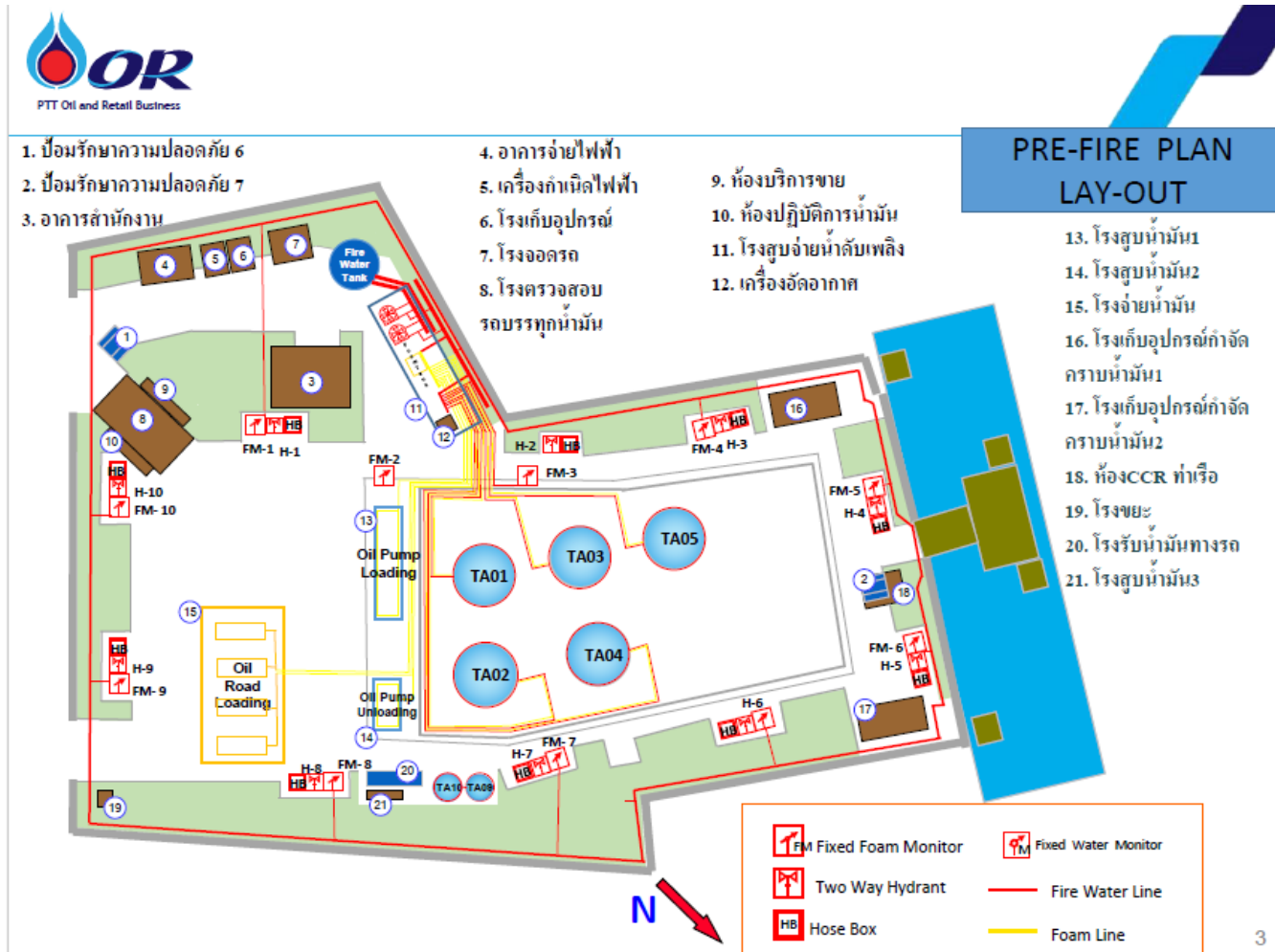
รูปที่ 1.4-3 ผังพื้นที่บริเวณคลังน้ำมัน