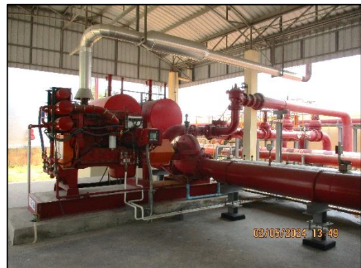
โรงสูบน้ำดับเพลิง