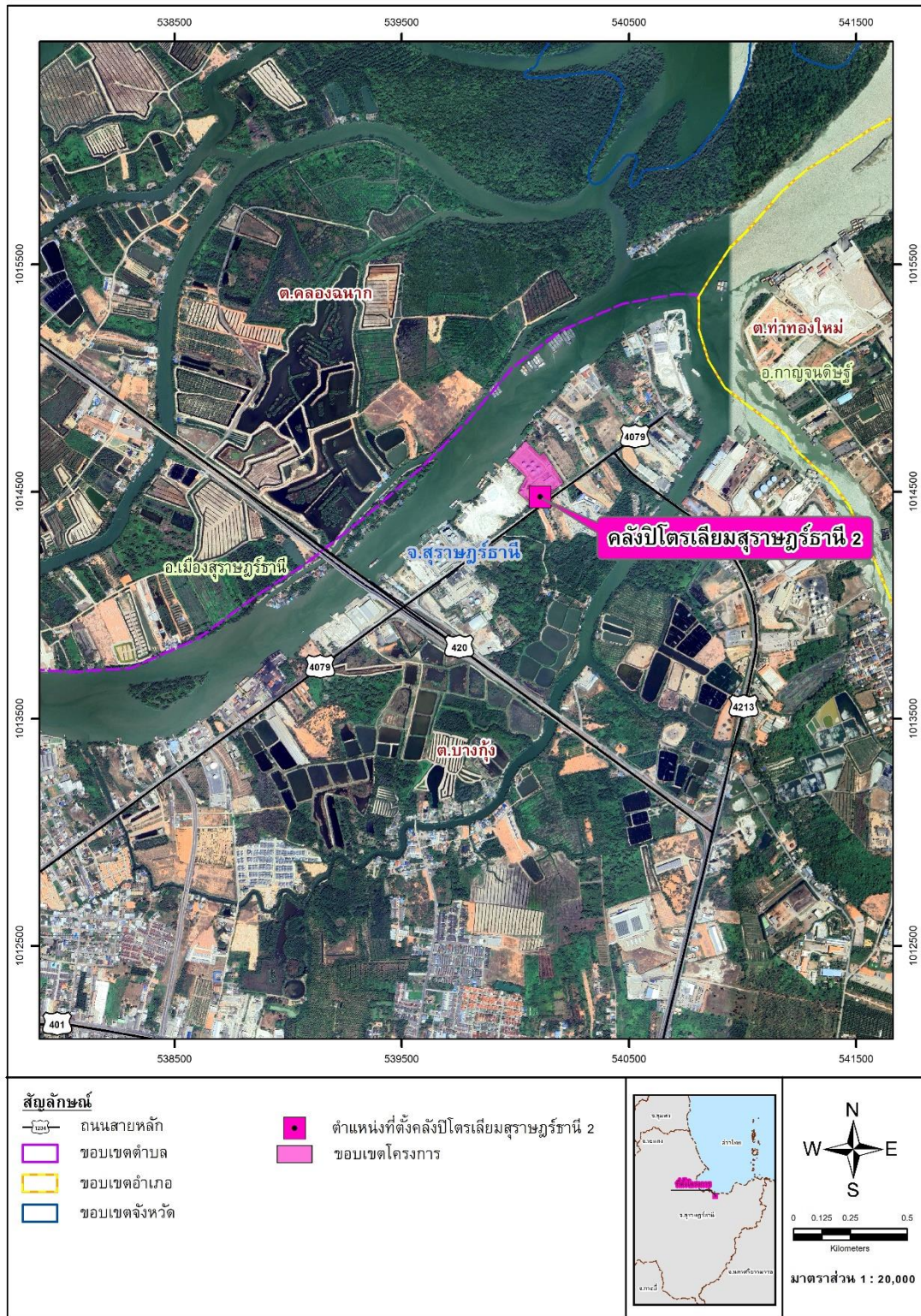
รูปที่ 1.4-1 ที่ตั้งและขนาดโครงการ