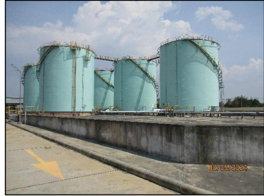
คลังน้ำมัน